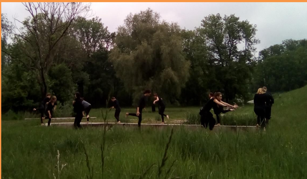
BDŠ navštěvují studenti z celé ČR i jiných zemí.

BDŠ navštěvují studenti z celé ČR i jiných zemí. Zastává významné místo ve svém oboru činnosti především proto, že metodu Jacques Lecoq vyučuje jako jediná v ČR i na Slovensku.