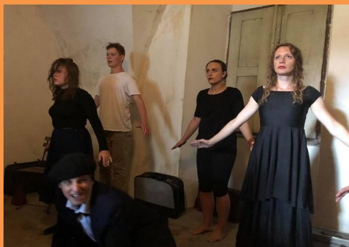
To jsme byli my

Z ohlasů diváků: Mohu potvrdit, že výsledky studentů jsou opravdu pozoruhodné a zážitky z jejich vystoupení se zapisují hluboko do duše a do srdce!