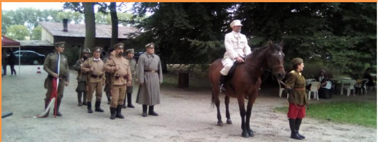
Příjezd prezidenta T. G. Masaryka a slavnostní vítání s publikem