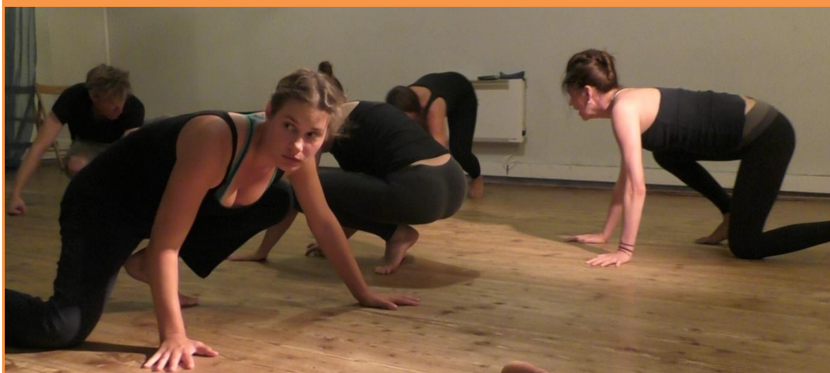
Letní týdenní workshop – Od Inspirace k Tvorbě.