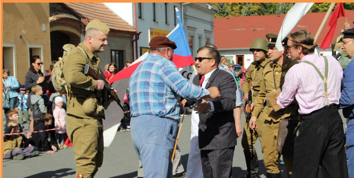
Zahájení sobota 29. září. ve 12 hodin. TENKRÁTE V 68 na náměstí v Křinci.