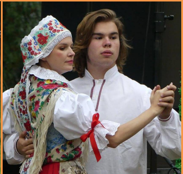
Nechyběla živá hudba a tanec: hudba KVH Druhý pluk Nymbursko, tanec Spolek Budil