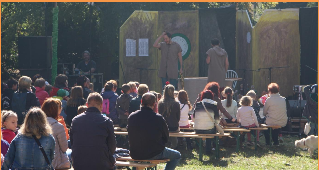
Pohádka Král Karel divadla Toymachine pro děti.